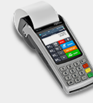
Mobil Yazar Kasa POS Ingenico iWE280

Başvuru Yapmak İstedığınız Bankayı Seçiniz