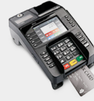
Sabit Yazar Kasa POS Ingenico iDE280